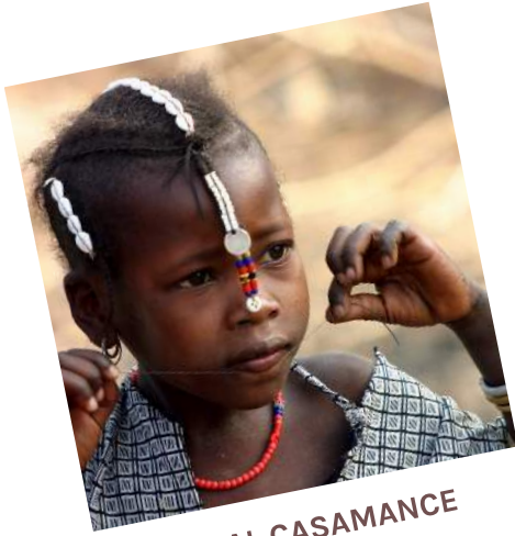
SENEGAL CASAMANCE (20 NOV > 02 DEC 2024)