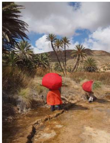
RANDONNEE DANS LE SUD TUNISIEN (09 NOV > 16 NOV 2024)