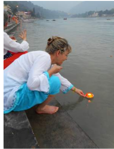
INDE DU NORD - A LA SOURCE DU GANGE (06 OCT > 04 NOV 2024)